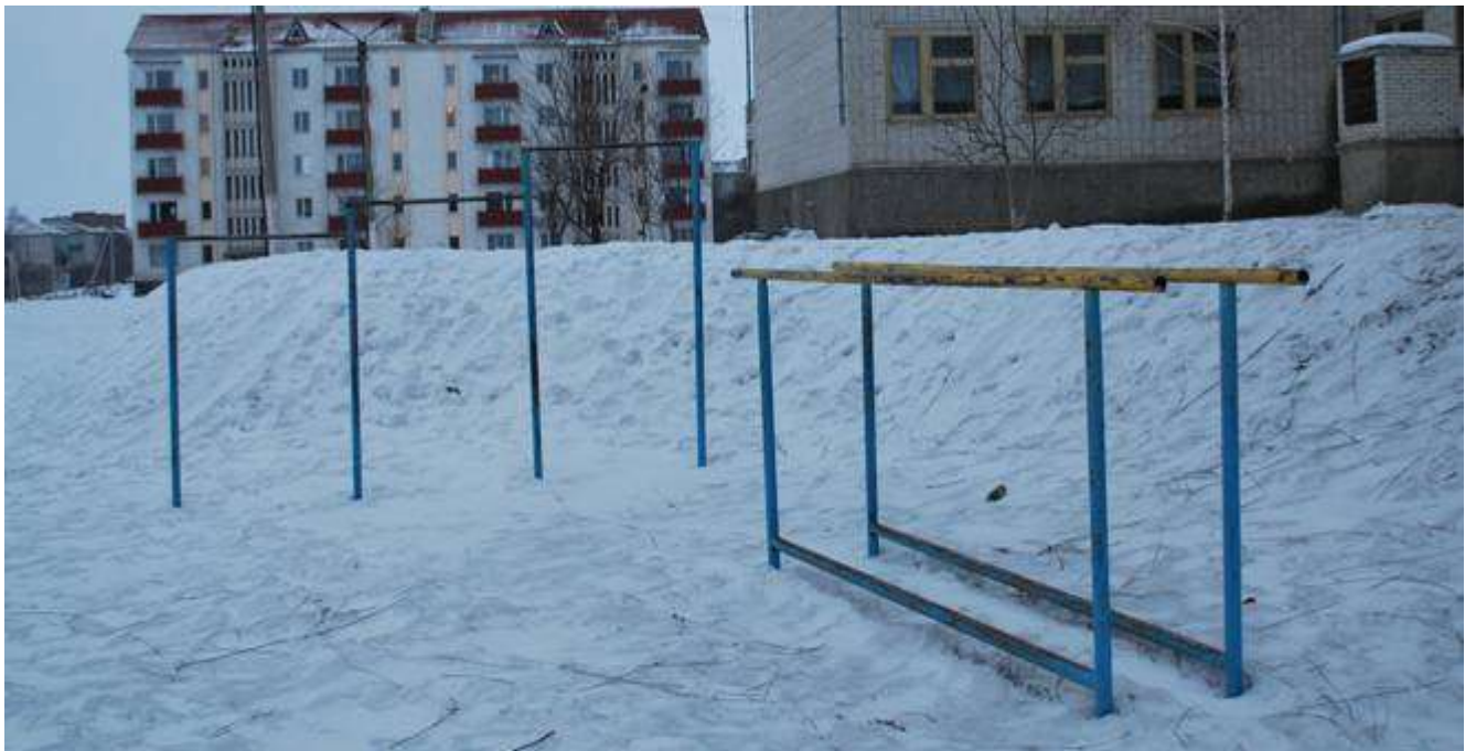
Фото 2 - Площадка біля стадіону школи №4