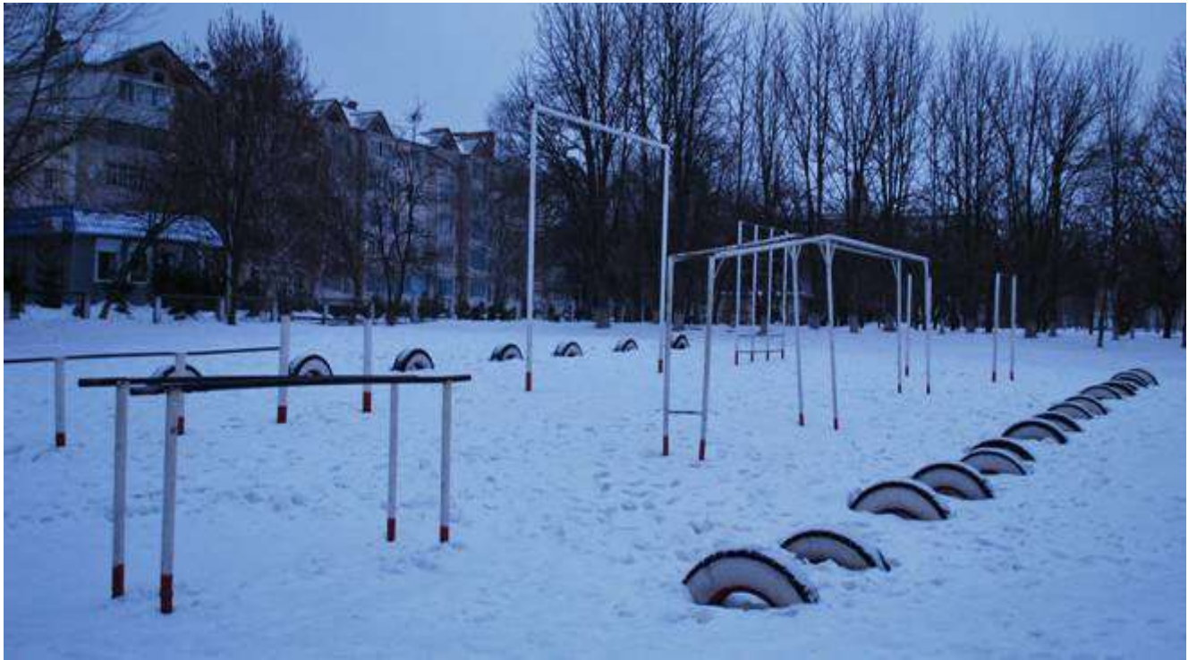
Фото 1 - Площадка біля стадіону школи №3